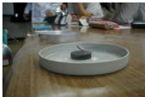
マイスナー効果の実験