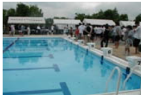
普及部門会場 (大津市)

5. 課題 参加するにはそれなりの事前準備と研究が必要。ソーラーパネルやスクリューなど総合的な工作力が必要という感想を持った。