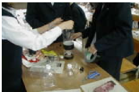
ペットボトルロケットの組み立て