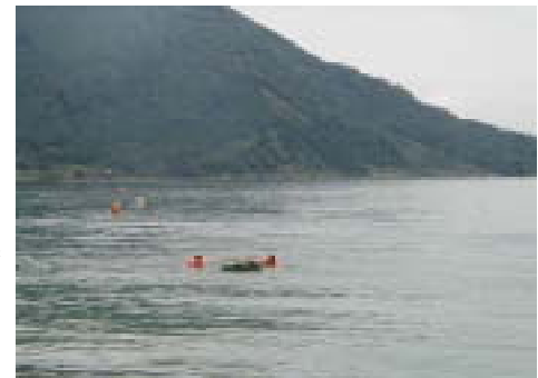
先端技術部門会場（マキノ町）

出力を見ると、20W、269.4W、100W ... と、ばらつきがありました。不思議に思い聞いてみると、出力の違いは、1、どのような条件下で測定したか、2、ソーラーパネルの種類、によって生じると分かりました。おまけに、実際の大会では、天候に左右されやすく、曇ってくると、晴れのときの 1/20 にまでなってしまうほどです。ソーラーパネルの種類は、出力の大きい順に、単結晶シリコン型、多結晶シリコン型、アモルファスシリコン型