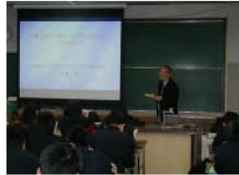
ライフサイクルアセスメント