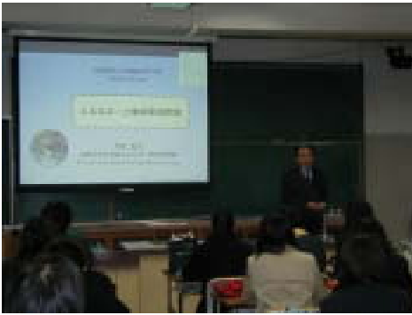
エネルギーと地球環境問題